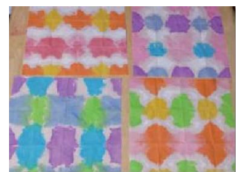
和紙を広げて乾燥すると完成