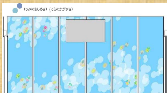
1階外来待合カーテンウォール アートワーク展開イメージ