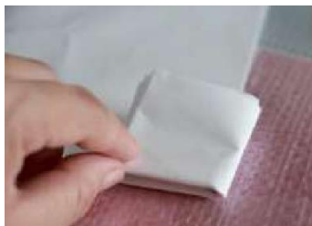
和紙を自由に折り畳みます

日時 平成30年10月20日（土）午前11時～午後3時 場所 光市立光総合病院（光総合病院フェスタin虹ヶ浜会場内） 内容 「光市のいろ」をつくろうをテーマとして、和紙を絵具に浸して、染め紙を作成します（下図参照）