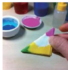
和紙を絵具に浸します